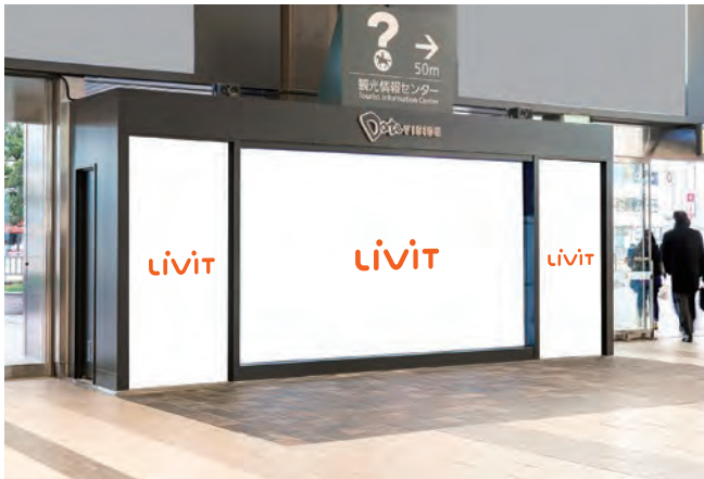
Date VISIONジャック (オプションパネル使用時イメージ)