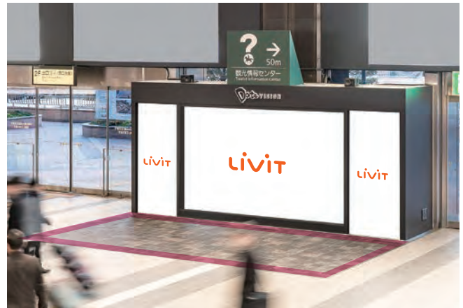
Date VISIONイベントスペース (オプションパネル使用時イメージ)