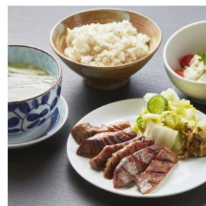
熟成厚切り牛たん 2,200円（税込）