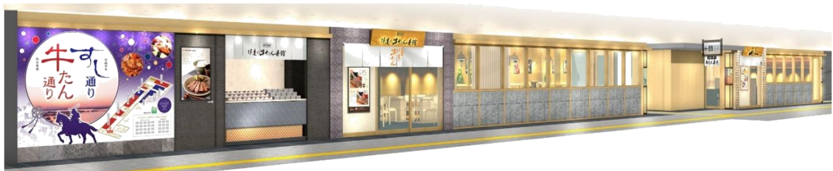
店舗外観イメージ