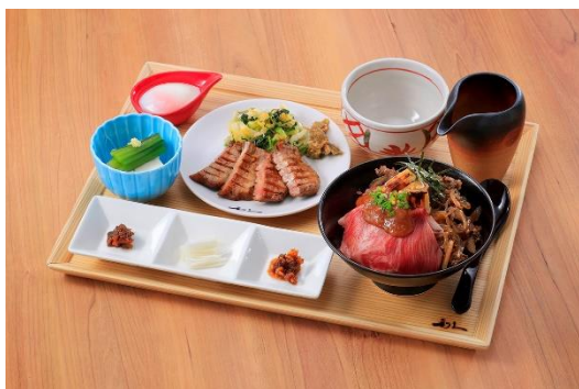
牛たん炭焼き 利久