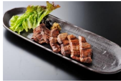
国産和牛特上牛たん塩焼 4,000円 (税込)