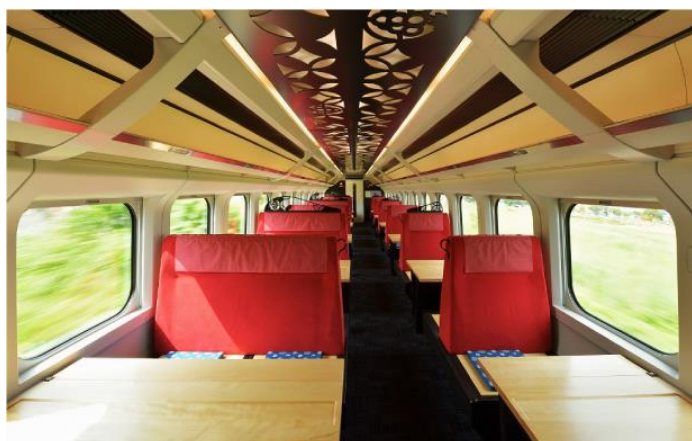
「とれいゆ つばさ」内観

販売する商品は、キャビネット（3種類）、アートボード（3種類）、テーブル（2種類）の計8種類です。「とれいゆ つばさ」の象徴でもあるデザイン性の高い部品をそれぞれに使用しており、温かみのある木の素材をふんだんに用いていることが特徴です。東北のオーダーメイド家具メーカーである株式会社クラスコファニチャーが、実際に使われていた部品を活用して製作するため、数量限定で受注生産します。