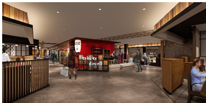
店舗内観イメージ