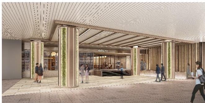
仙台駅側メインエントランスイメージ