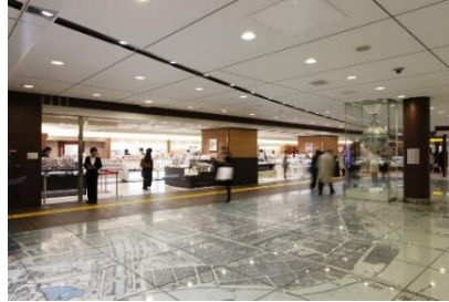
限定商品や限定ショップが並ぶ「銀の鈴エリア」