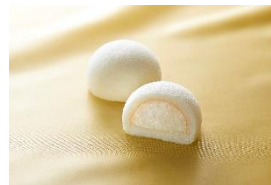
「萩の調 煌」 菓匠三全